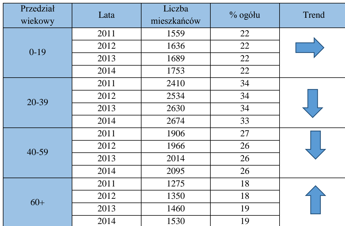
Tabela nr 7 Struktura wiekowa mieszkańców Gminy Stawiguda w latach 2011 – 2014.

Źródło: opracowanie własne na podstawie danych z Głównego Urzędu Statystycznego