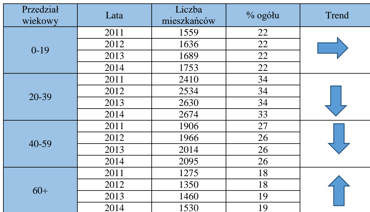
Tabela nr 6 przedstawia strukturę wiekową mieszkańców Gminy Stawiguda w latach 2011 – 2014.

Zródło: opracowanie własne na podstawie danych z Głównego Urzędu Statystycznego