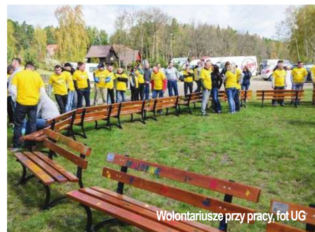
Wolontariusze przy pracy