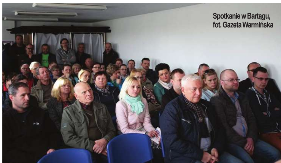
Spotkanie w Bartągu

Mieszkańcy okolicznych miejscowości bardzo szybko zareagowali na doniesienia prezydenta Olsztyna. Ludzie opowiedzieli się przeciwko jakimkolwiek zmianom. Sołtys