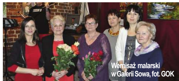
Wernisaż malarski w Galerii Sowa, fot. GOK

Pasjonatki malowania ze Stawigudy zaprezentowały swoje dzieła w olsztyńskiej Galerii Sowa.