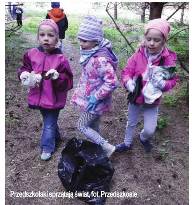
Przedszkolaki sprzątają śmieci, fot. Przedszkole