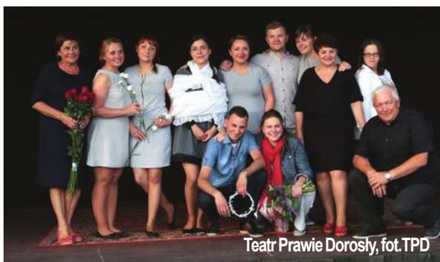
Teatr Prawie Dorosły

W tym roku scena w Bartągu będzie wypełniona artystami, których miłość do teatru, realizowanej pasji płynie prosto z serca. Planujemy około pięciu występów grup teatralnych, artystycznych. Nie zabraknie rozrywki dla najmłodszych i domowych smakoszy, które rozpieszczą Wasze podniebienia. Wisienką na torcie będzie występ muzyka, kompozytora, wokalisty, autora tekstów -