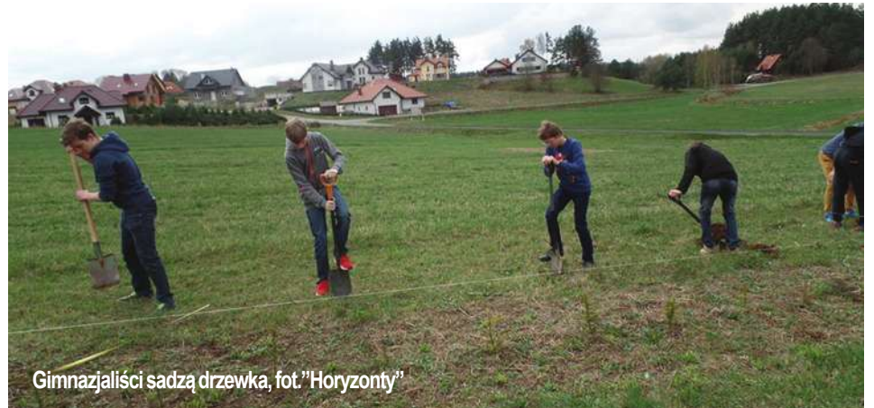
Gimnazjaliści sadzą drzewka, fot. "Horyzonty"

Gimnazjum w Stawigudzie włączyło się w obchody Święta Ziemi. Uczniowie uczestniczyli w tematycznej wycieczce do Gdańska – poznali życie zwierząt, zwiedzając oliwskie Zoo, odwiedzili także gdyńskie Akwarium, gdzie oprócz podziwiania zwierząt morskich brali udział w zajęciach poświęconych rafie koralowej. Mogli dotknąć rafę, poznać dokładniej życie tych zwierząt. Atrakcją tej wycieczki była gra terenowa w parku Reagana zorganizowana przez