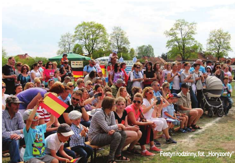
Festyn rodzinny, fot. „Horyzonty”

Gimnazjaliści zaangażowali rodziny do udziału w wielu konkursach: wspólne bicie piany, obieranie ziemniaków na czas, portretowanie dzieci. Początkowo chętnych jakby brakowało, ale podziałały zachęty dzieciaków i chęć rywalizacji. Już po chwili rodzice z dziećkami ustawiali się do kolejnych konkursów. Każdy uczestnik rywalizacji otrzymywał od or-