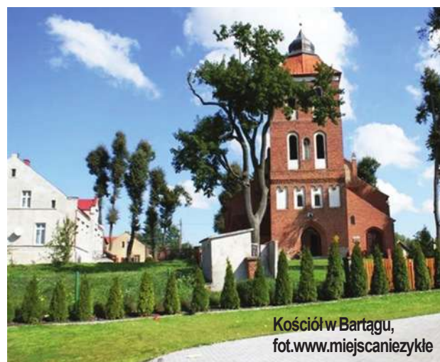
Kościół w Bartągu

mie) miejscowość trzeba było na nowo zasiedlać. Robił to między innymi Mikołaj Ko-