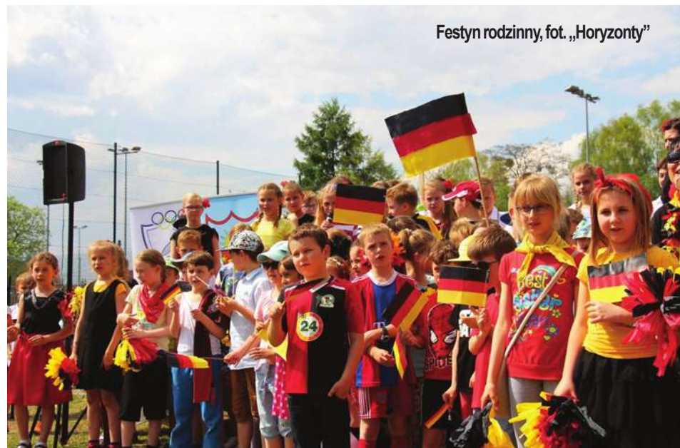
Festyn rodzinny

Teraz pozostały zdjęcia, które są dowodem na świetną zabawę i pamiątką po „rodzinnym dniu”. Fotorelację ze spotkania można obejrzeć na profilu Facebook Publicznego Gimnazjum im. Olimpijczyków Polskich w Stawigudzie.