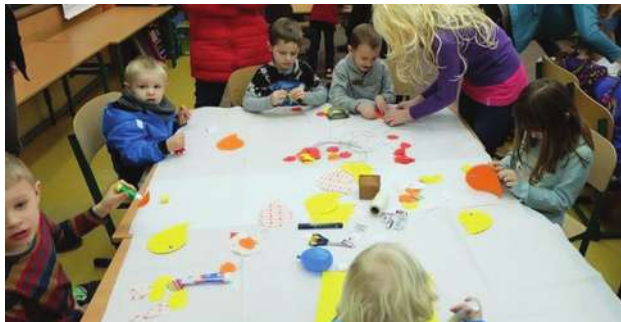
Dni otwarte w szkole podstawowej

Stawigudzka Szkoła Podstawowa czeka na nowych uczniów. Na ich zaproszenie do placówki przybyły przedszkolaki z grupy „Żuczki” i „Pszczółki”. Sprawdzały one swoje umiejętności polonistyczne i matematyczne na tablicy multimedialnej, poznawały podstawowe słowa i słuchały piosenki w języku niemieckim, rozwijały swoje talenty plastyczne, uczestniczyły w zabawach na sali gimnastycznej, a na pożegnanie dostały ba-