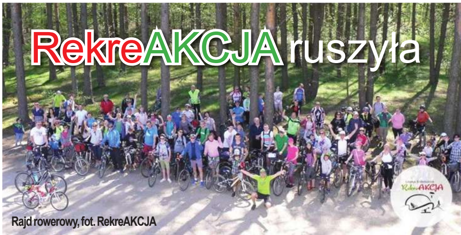
Rajd rowerowy, fot. RekreAKCJA