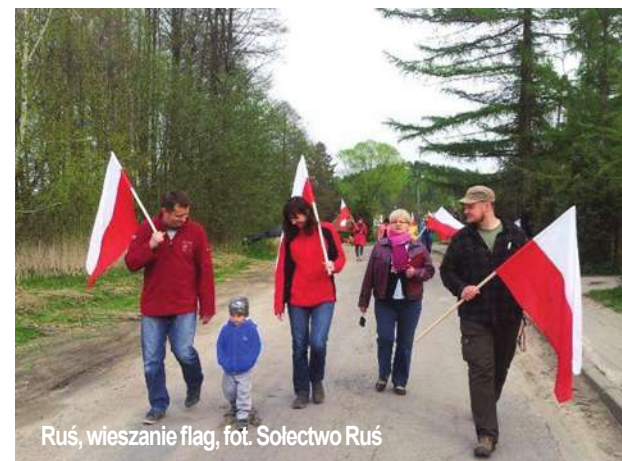
Ruś, wieszanie flag