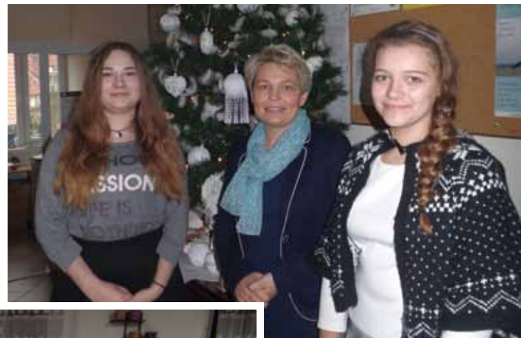
Choinka od KGW w Stawigudzie

domach. Dzieci będą mogły wspólnie ze strażą pożarną ubrać wiejską choinkę na placu przy boisku sportowym. Koło Gospodyń Wiejskich prężnie działa również w Rusi. Miejszem ich spotkań jest tętnięcia życiem świetlica wiejska. Systematycznie organi-