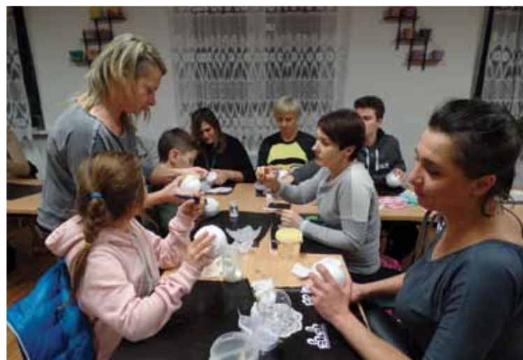
Warsztaty KGW w Rusi

dzona przez Sołtysa i Radę Sołecką. W ramach projektu odbędą się warsztaty rękodzieła – uczestnicy będą wykonywać tradycyjne ozdoby świąteczne. Prowadzący będą opowiadać uczestnikom historię Świąt Bożego Narodzenia na Warmii oraz w ich rodzinnych