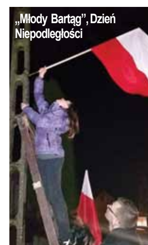
„Młody Bartąg”, Dzień Niepodległości

do tego, aby społeczeństwo zintegrowało się, współpracowało ze sobą i wspierało siebie nawzajem. Stowarzyszenie ma w planach wiele spotkań i inicjatyw oraz współpracę z innymi organizacjami pozarządowymi, również ze Stawigudy. Pierw-