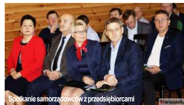
Spotkanie samorządowców z przedsiębiorcami

biorców - mówi jeden z uczestników spotkania. -Poznaaliśmy się, wymieniliśmy doświadczenia, narodziły się pomysły do współpracy. Pozytywnie spotkanie ocenia też wójt gminy: - Współpraca z państwem - zwróciła się do przedsiębiorców - to również zysk dla gminy. Dlatego dołożę wszelkich starań, aby wesprzeć państwa w tych działaniach.