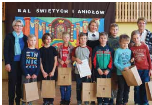
Inauguracja MegaMisji w ZSP w Stawigudzie

Udział w przedsięwzięciu wymaga od uczniów dużej sys-