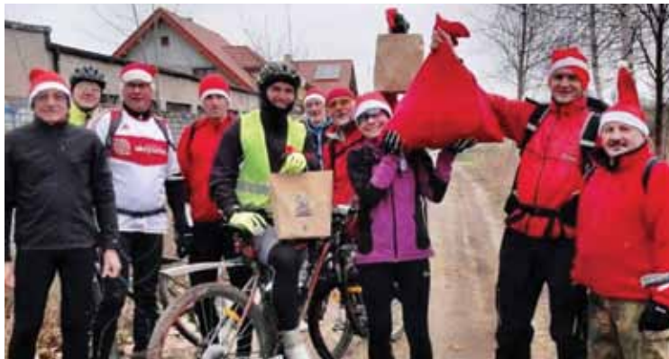
Mikołaje z RekreAkcji

W tym roku spotykaliśmy się kilkanaście razy i zasmakowaliśmy różnych aktywności.