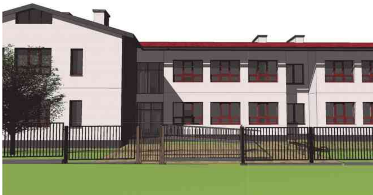
Projekt architektoniczny nowej szkoły z urządzeniami sportowymi

Docelowo w szkole podstawowej w Bartągu mają się znajdować 24 oddziały, każdy po około 20 uczniów. Naukę zatem będzie pobierać mniej więcej 400 uczniów. Jednak budynek budo-