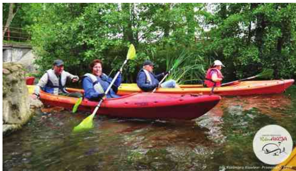
Kajakami po Marózce

W niedzielę 14 sierpnia odbył się czwarty spływ kajakowy rzeką Marózką, organizowany przez Gminny Ośrodek Kultury w Stawigudzie w ramach akcji RekreAKCJA.