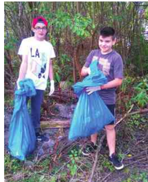
Wszyscy chętnie zbierali śmieci

Tak naprawdę szkoła nie zyskuje niczego. Zysk jest po stronie młodzieży i wszystkich osób uczestniczących w akcji, a przede wszystkim środowiska, które nas otacza i jest naszym „miejscem na Ziemi”.