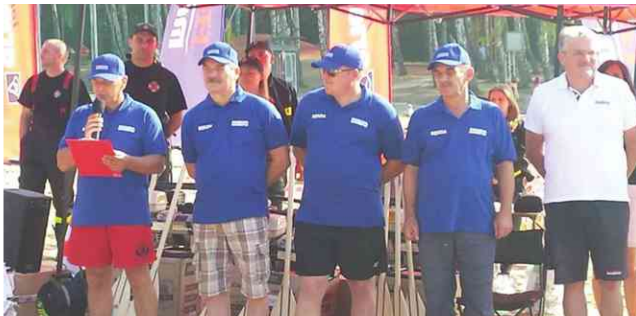
Zwycięska drużyna z Pluski