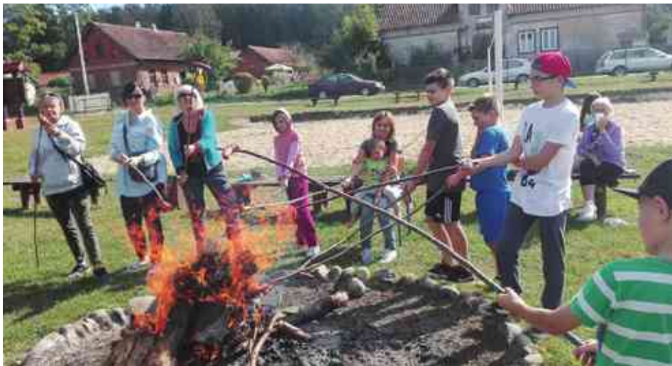
Wspólne ognisko z kielbaską, która najlepiej smakuje z przyjaciółmi