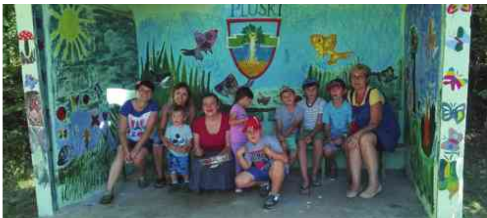
Chętnych do zabawy nie brakowało

Widzom jednak najbardziej w pamięci zapadły występy zespołów folklorystycznych z całego świata. Podczas tegorocznych prezentacji na scenie zagościły zespoły z Gruzji („Mego-broba”) i Boliwii („Compania de Danza Acuarela”). Egzotyka występów szła w parze z bardzo wysokim poziomem artystycznym i niezwykłym urokiem artystów. Wielu widzów zdziwiła też sprawność fizyczną artystów i piękno ich strojów. Egzotycznym gościom w niczym nie ustępował lokalny zespół Dybżaki. Aby urozmaicić widzom czas spędzony na plaży, organizatorzy zaprosili też Stare Drobne Małże, którzy jak zwykle przypomnieli nam dobrze znane polskie przeboje.