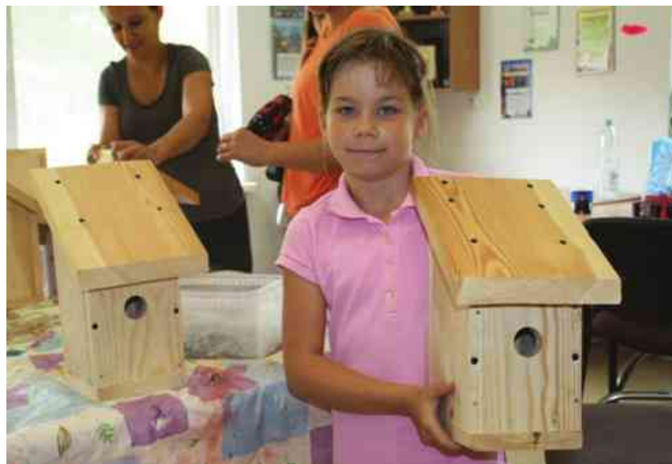
Ptaki również potrzebują mieszkań

Na przełomie lipca i sierpnia w Tomaszkwie realizowany był projekt „Ptaki i rośliny wodne”. W ramach akcji mieszkańcy Tomaszkowa wspólnie sprzątali teren wokół Jeziora Wulpińskiego. Aby zwiększyć swoją wiedzę o faunie i florze Warmii i Mazur, 20 uczestników projektu zwiedzało arboretum w Kudypach.