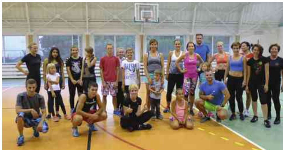
Europejski Tydzień Sportu W Stawigudzie cieszył się sporą frekwencją

Europejski Tydzień Sportu jest inicjatywą prowadzoną przez Komisję Europejską. Realizacja konkretnych działań w całej Europie jest w dużym stopniu zdecentralizowana i odbywa się w ścisłej współpracy z koordynatorami krajowymi i wieloma różnymi partnerami zaangażowanymi w inicjatywę. Poszczególne działania promocyjne będzie również wspierał zespół ambasadorów.