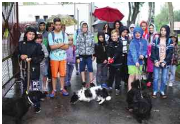
Codzienne zajęcia spotkały się z większym zainteresowaniem w Tomaszowie i w Rusi