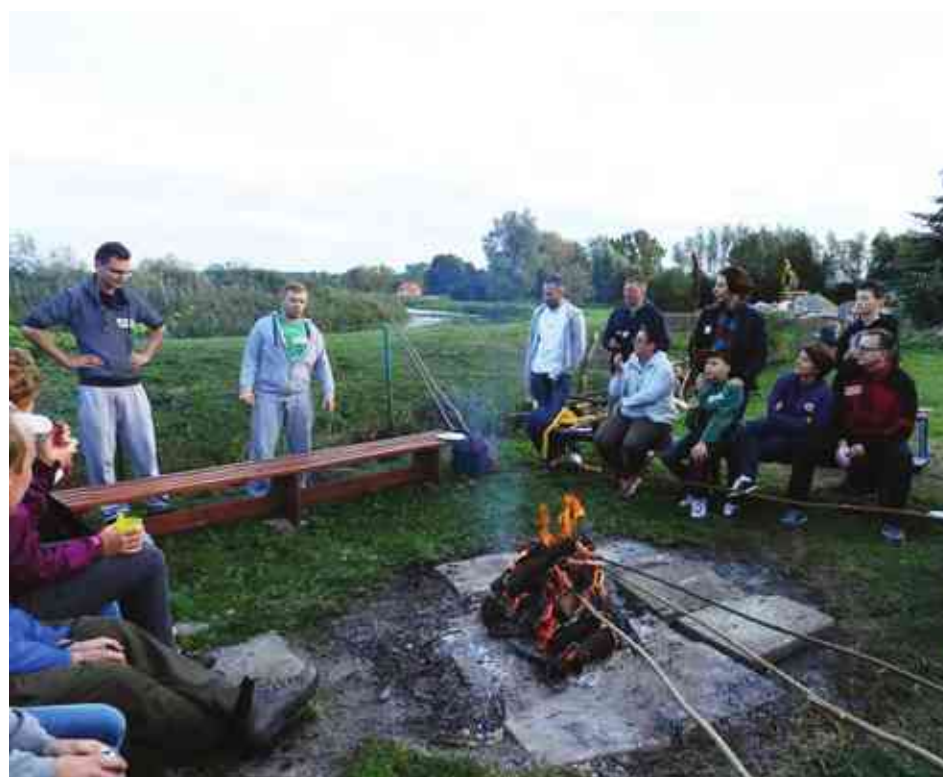
Wspólne ognisko to dobry pomysł, żeby się lepiej poznać

Stowarzyszenie Młody Bartąg zorganizowało ognisko dla sąsiadów