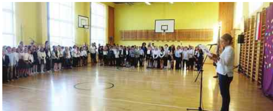
Pierwszy dzwonek po wakacjach w Szkole Podstawowej w Rusi

a szkoła budowana w Bartągu weźmie pod opiekę klasy 1-3. Szkoła Podstawowa w Stawigudzie też się rozwija, a osią-