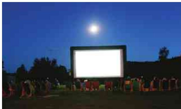
Kino pod chmurką- sposób na letnie wieczory

Na terenie Gminy Stawiguda wakacyjne wieczory umiła Letnie Kino pod Chmurką.