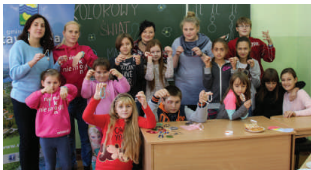
Uczestnicy warsztatów z własnoręcznie wykonana biżuterią