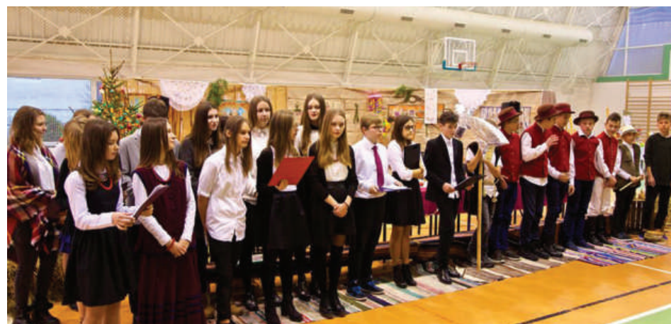
Festyn w Gimnazjum, fot.org.

No i jeszcze coś dla oczu: wykonane przez uczniów, rodziców i nauczycieli ozdoby świąteczne: stroiki, bombki,