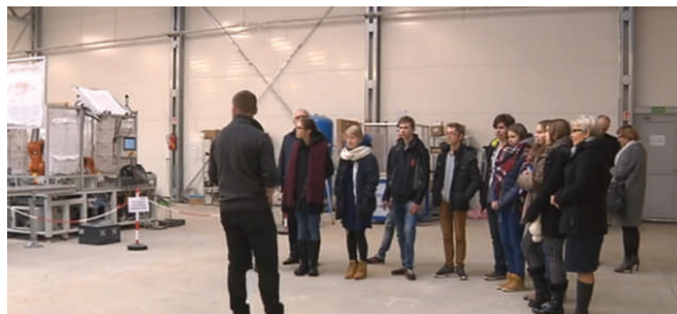
Spotkanie gimnazjalistów w Alnei

Kolejnym etapem programu było laboratorium Generalnej Dyrekcji Dróg Krajowych i Autostrad w Olsztynie. Młodzi ludzie przekonali się, że budowa drogi odbywa się również poza placem budowy i, że to od ludzi tu pracujących nierzadko zależy jakość drogi. Tym razem uczniowie mogli obserwować, jak wygląda praca w laboratorium drogowym. Laboratorium drogowe prowadzi badania związane z jakością budowanych dróg. - Trochę przypomina to laboratorium chemiczne – wspomina jeden z uczestników spotkania. Nowoczesność technologii zaskoczyła młodzież, ale też