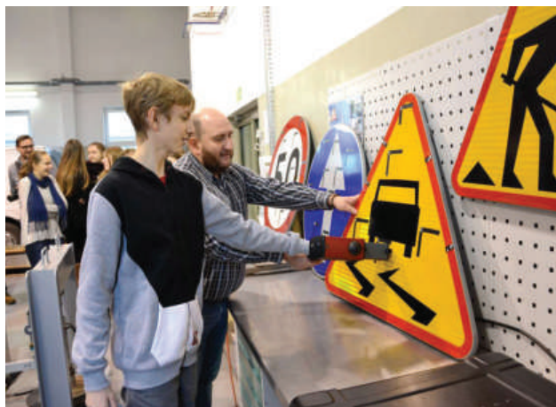
Spotkanie uczniów w gimnazjum w GDDKiA

Kuratorium Oświaty, Warmińsko-Mazurska Strefa Ekonomiczna i stawigudzka firma Alnea są inicjatorami Programu Wspomagania Uczniów w Wyborze Zawodu LABORATORIUM. Jedną ze szkół biorących udział w programie jest Gimnazjum ze Stawigudy.