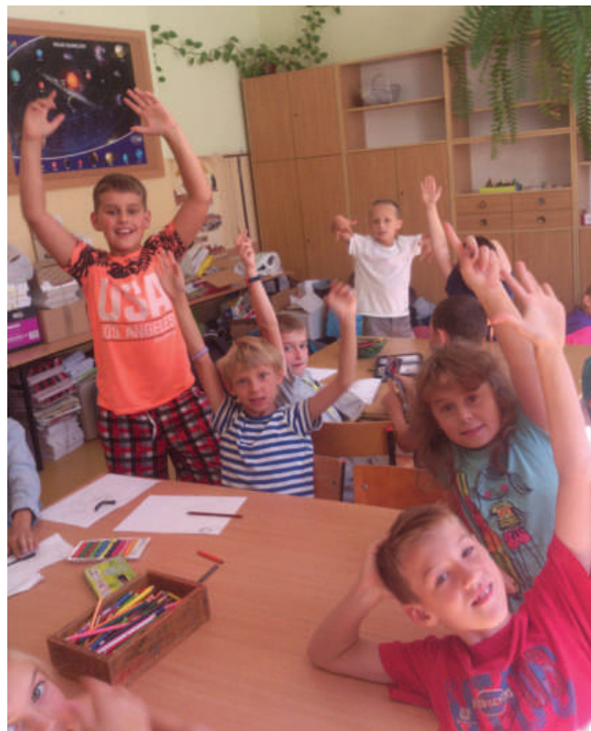
Uczestnicy warsztatów Mega Misji w SP w Stawigudzie

MegaMisja to nowoczesny program cyfrowej edukacji w świetlicy w szkole podstawowej. Program obejmuje swoim zasięgiem już kilka tysięcy dzieci w całej Polsce. Wśród nich są dzieci ze stawigudzkiej SP.