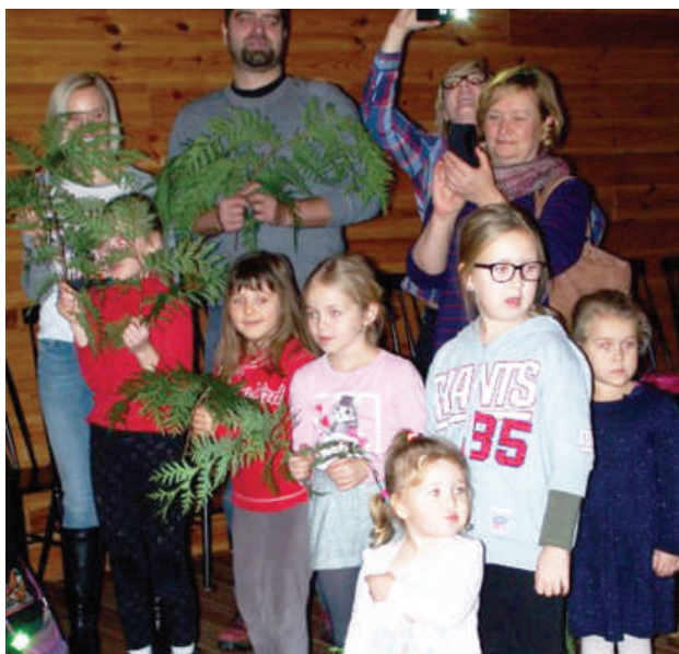
Spotkanie świąteczne w Tomaszkowie