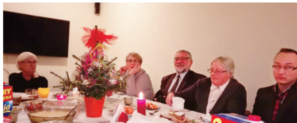
Spotkanie świąteczne w Pluskach