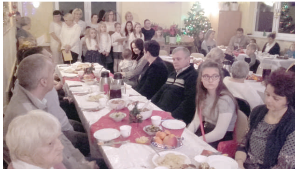
Wigilia w Gryźlinach, fot.org.

Po raz kolejny mieszkańcy sołectwa Pluski-Rybaki spędzili Mikołajki na integracyjnym wyjeździe. Dnia 4 grudnia autokarem oraz prywatnym transportem licznie udaliśmy się do Olsztyna.