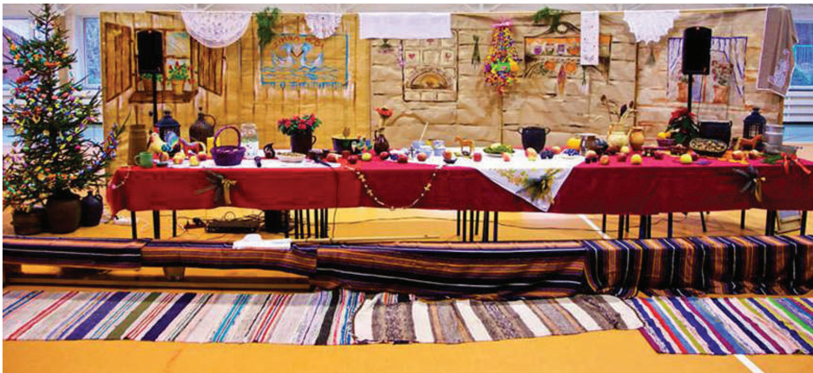
Chata Warmińska - dekoracja z Festynu Warmińskiego w Gimnazjum