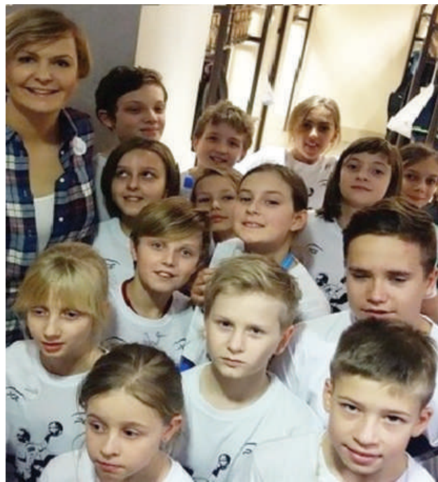
Uczniowie SP w Warszawie razem z Otylią Jędrzejczak

Pełna grupa dzieci i trenerów. Wraz z nimi, gaj by jankrem. Cześć