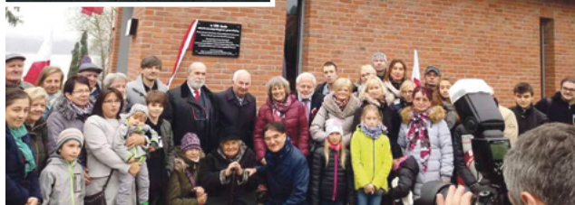
Uroczyste odsłonięcie tablicy