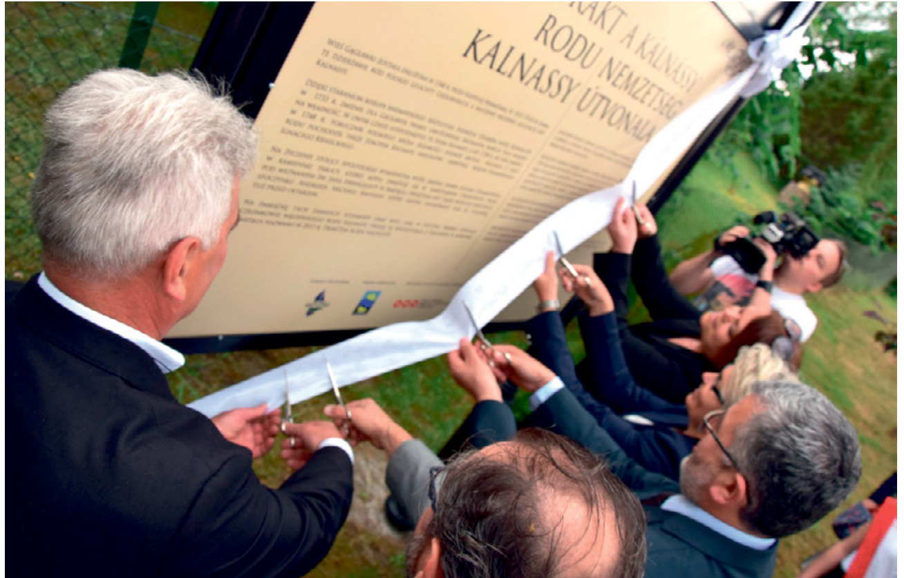
Odsłonięcie tablicy w Gąglawkach.