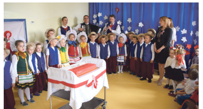
Odsłonięcie głazu w przedszkolu w Stawigudzie.

Z okazji obchodów 100-ecia Niepodległości Polski przedszkole w Bartągu przygotowało wiele atrakcji zarówno dla dzieci, rodziców jak i zaproszonych gości. 9 listopada odbyła się akademia, podczas której odśpiewano Hymn Państwowy. Następnie wystąpił chór „Legenda”. Chórzyści