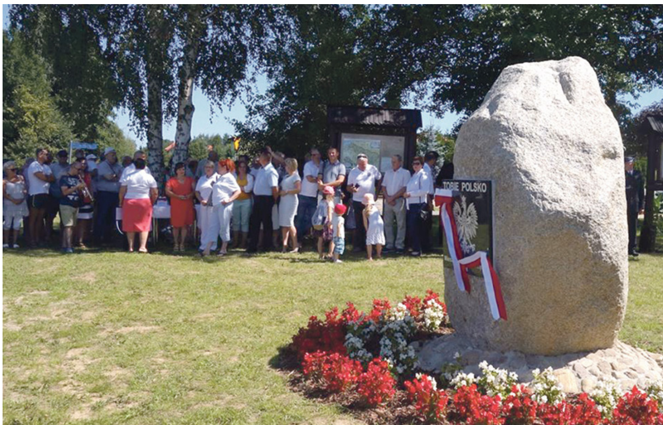
Otwarcie parku w Majdach

Już wkrótce będziemy mogli uczestniczyć w Spotkaniu Warmińskim na temat niepodległości w ujęciu wpływu historii na współczesność.