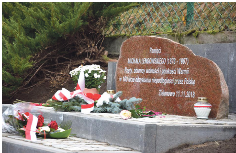
Odsłonięcie tablicy pamiątkowej w Zielonowie.

Uroczysta msza święta w kościele pw. Św. Wawrzyńca w Gryźlinach rozpoczęła uroczyste obchody rocznicy odzyskania przez Polskę niepodległości.