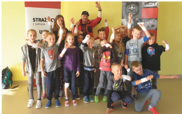
Uczniowie z Bartąga uczą się ratować.