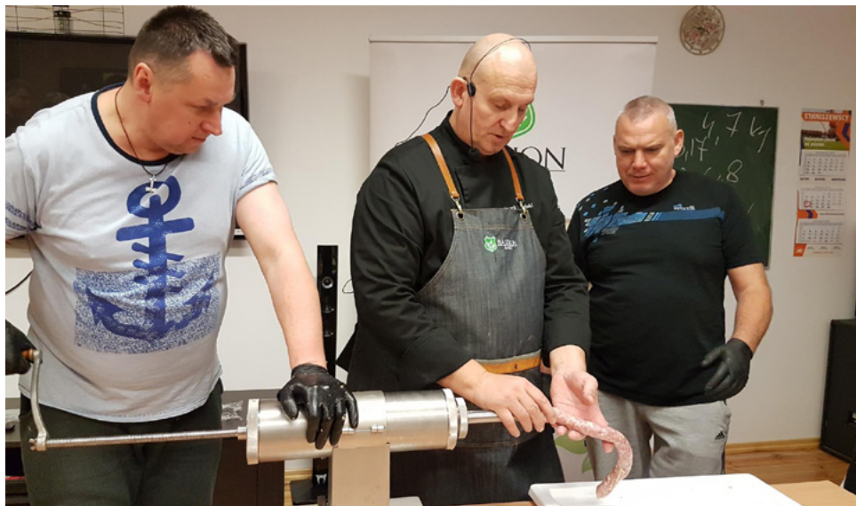
uczestnicy projektu stowarzyszenia Dajmy Szansę

No ale Pani sołtys i Baby Ruśkie dopiero się rozkręca-