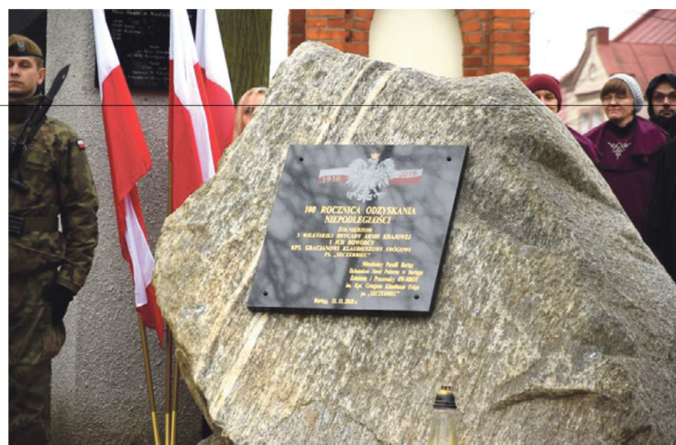
Uroczystości z okazji rocznicy odzyskania niepodległości w Bartągu.