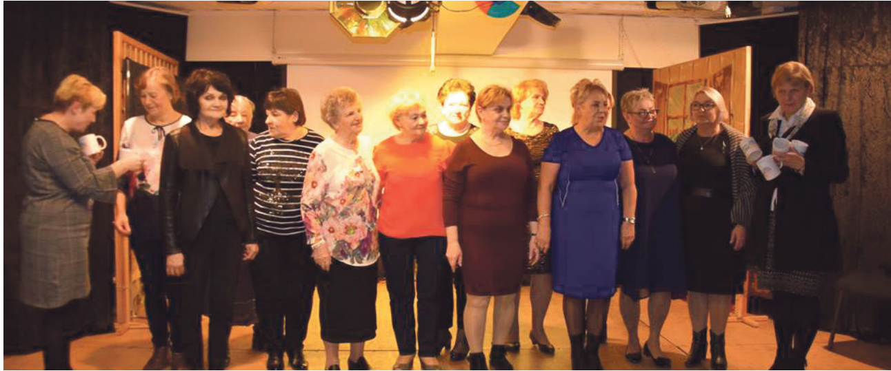
Uczestnicy projektu stowarzyszenia Dajmy Szansę