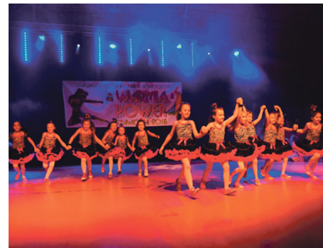
Uczestnicy turnieju świetnie się bawili.