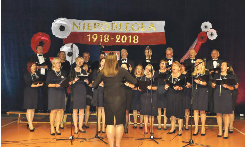
Występ chóru Konsonans z Tomaszkowa.

Podniosły nastrój, uroczyste słowa, wzruszające pieśni patriotyczne - mieszkańcy Gminy Stawiguda uczcili 100 rocznicę odzyskania przez Polskę niepodległości