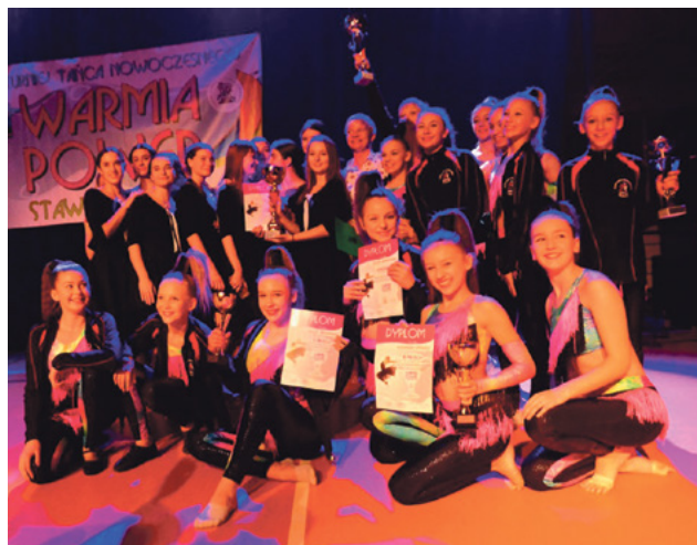
Uczestnicy turnieju Warmia Power.

dostępne na stronie internetowej Gminnego Ośrodka Kultury.