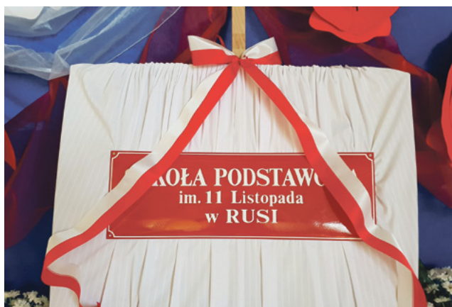
Uroczystość nadania imienia SP w Rusi.

6 listopada – to dzień który na długo zostanie nam w pamięci. Tego dnia w ramach obchodów 100. rocznicy odzyskania przez Polskę niepodległości Szkole Podstawowej w Rusi nadano imię 11 Listopada. Do tej uroczystości społeczność szkoły przygotowywała się od ponad roku.