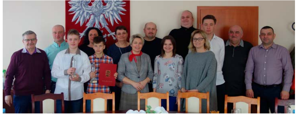
Laureaci statuetek dla najlepszych sportowców.