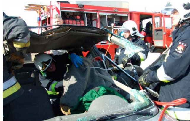
Strażacy pokazali jak ratują ofiary wypadków drogowych.

OSP w Bartągu zorganizowała ćwiczenia ratownictwa technicznego.