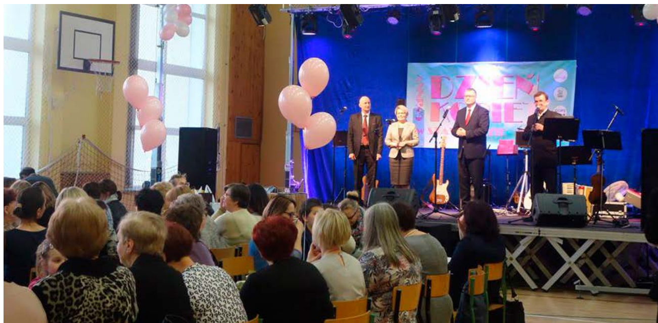
W drugim Gminnym Dniu Kobiet wzięło udział wiele stawigudzkich kobiet.

Były życzenia, konkursy, loteria z upominkami i kwiaty dla każdej z Pań biorących udział w tej niecodziennej imprezie