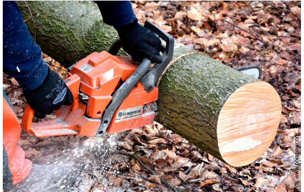
Nowe przepisy znacznie ułatwiły wycinanie drzew rosnących na prywatnych posesjach.

Nowelizacja ustawy o ochronie przyrody z dnia 16 grudnia 2016 r. wprowadziła dodatkowe zwolnienie rolników z obowiązku uzyskiwania zezwolenia na usu-