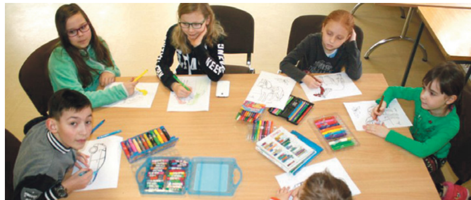
Ferie w Tomaszkanie