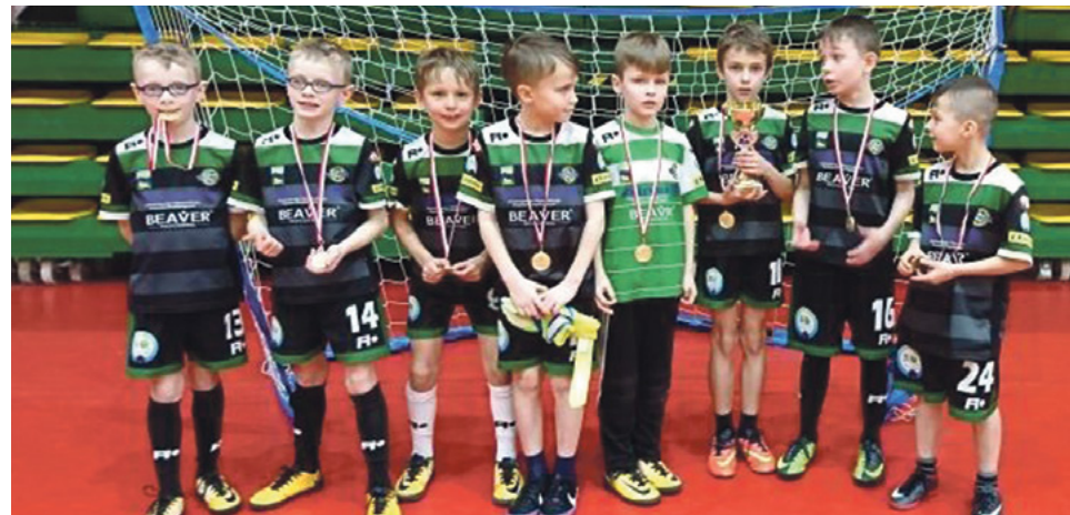
Zwycięzcy turnieju „Mały Jeziorak”