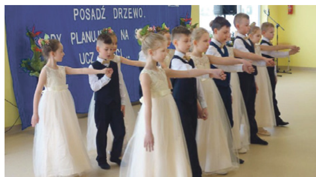
Podczas uroczystości dzieci zaprezentowały swój talent