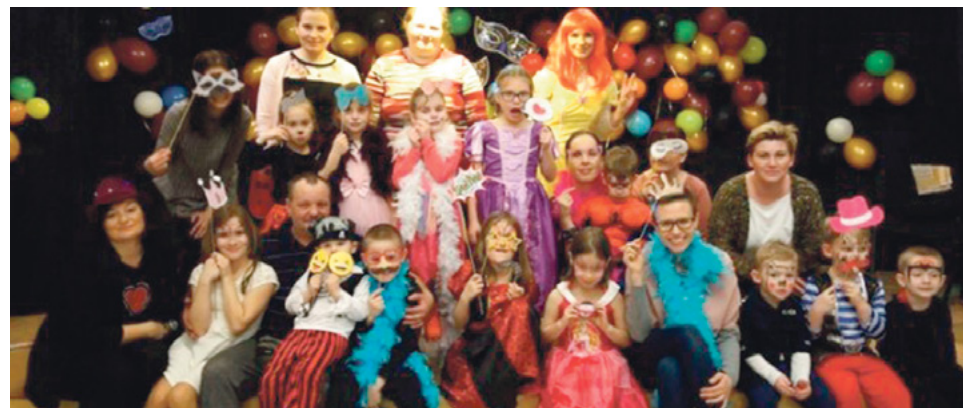
Bal karnawałowy w GOK