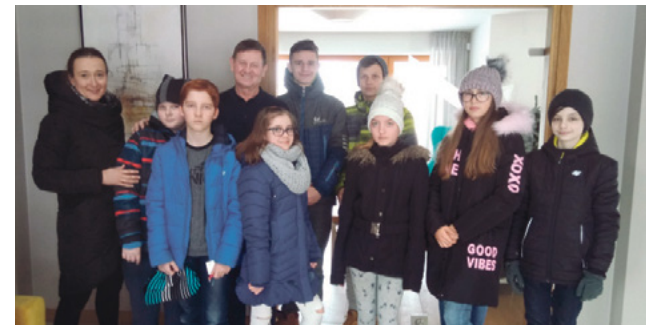
Wizyta uczniów ZSP w Brawo Domy Pasywne

- To jest bardziej takie polityczne pytanie. Raczej powin-