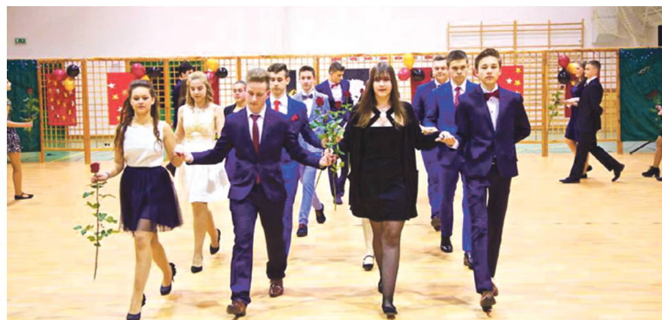
Bal gimnazjalistów rozpoczął się tradycyjnie polonezem