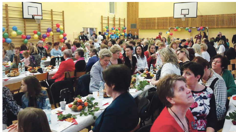
Podczas obchodów Dnia Kobiet w Zespole Szkolno-Przedszkolnym w Stawigudzie

W tej uroczystości wzięło udział ponad 200 pań. Mieszkanke gminy zostały przywitane kwiatami wręczonymi przez strażaków. Na stołach wypieki przygotowane przez Koła Gospodyń Wiejskich ze Stawigudy, Rusi i Gryżlin oraz panie z Zespołu Szkolno – Przedszkolnego. Punktem kulminacyjnym było rozkrojenie tortu, który okazał się nie tylko piękny, ale i wyśmien-